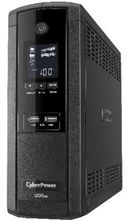
Backup BR 375